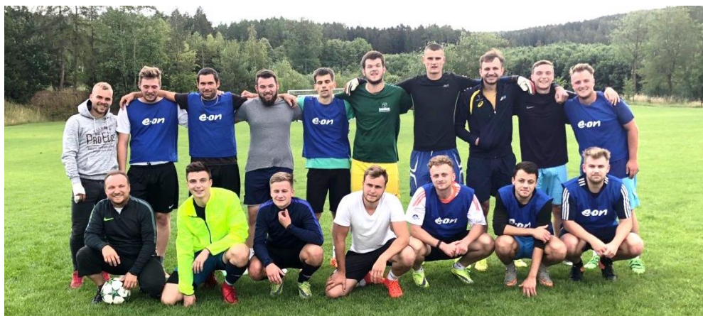
Foto z posledního tréninku fotbalové sezóny 2018-2019

Dorost jsme v letošním roce spojili s Knínicemi, kdy vzniklo společné družstvo Knínice/Cetkovice a bude hrát krajskou soutěž, skupinu A.