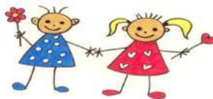
MATEŘSKÁ ŠKOLA CETKOVICE

V pondělí 2. září jsme se již všichni těšili na děti a rodiče. V tomto školním roce jich dochází do mateřské školy čtyřicet. Starší děti pomohly svým mladším kamarádům, kteří za námi přišli poprvé, se rychle zorientovat v novém prostředí. Protože nám přálo počasí, mohli jsme s dětmi první dny v mateřské škole trávit na školní zahradě. Děti jezdily