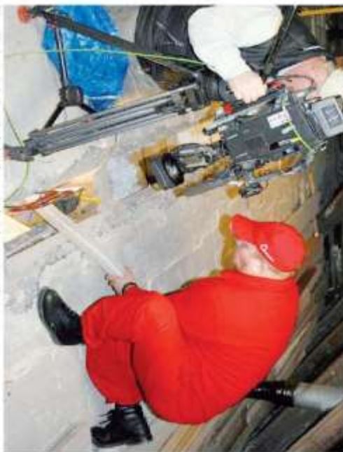
Při montáži produktu Roky práce lokavka - zateplení dvanácti hodinového stropu

Chcete více informací? Kontaktujte firmu IP POLNÁ, s.r.o. na telefonu 800 100 533 a my vám pomůžeme. Zastupce firmy zdarma přijede až k vám a vše vysvětlí na místě. Práci, pronáři, spočí kolik by vás to stálo a vy se v klidu rozhodnete. Nevěřte a mečkejte na zdražení energií.